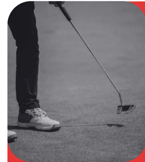
Pitch & Putt