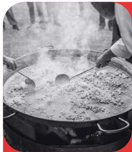
Concurso de paella