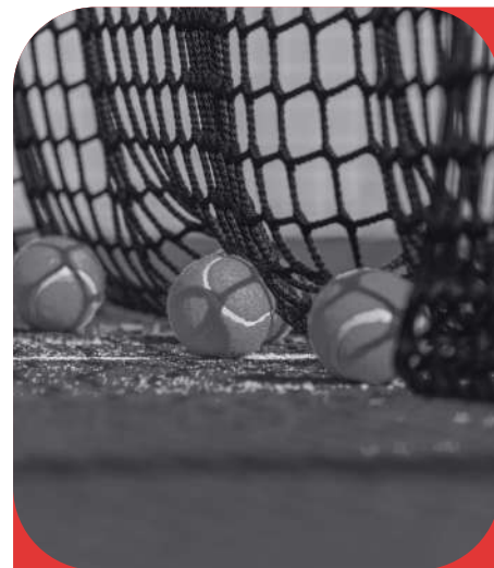
Pádel por equipos