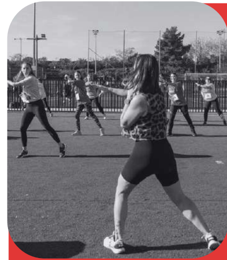
Fitness & Rhythm